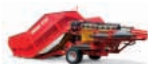
Trémie de réception