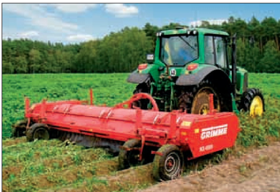
Avantages sur tous les rangs: le broyeur 6 rangs Grimme