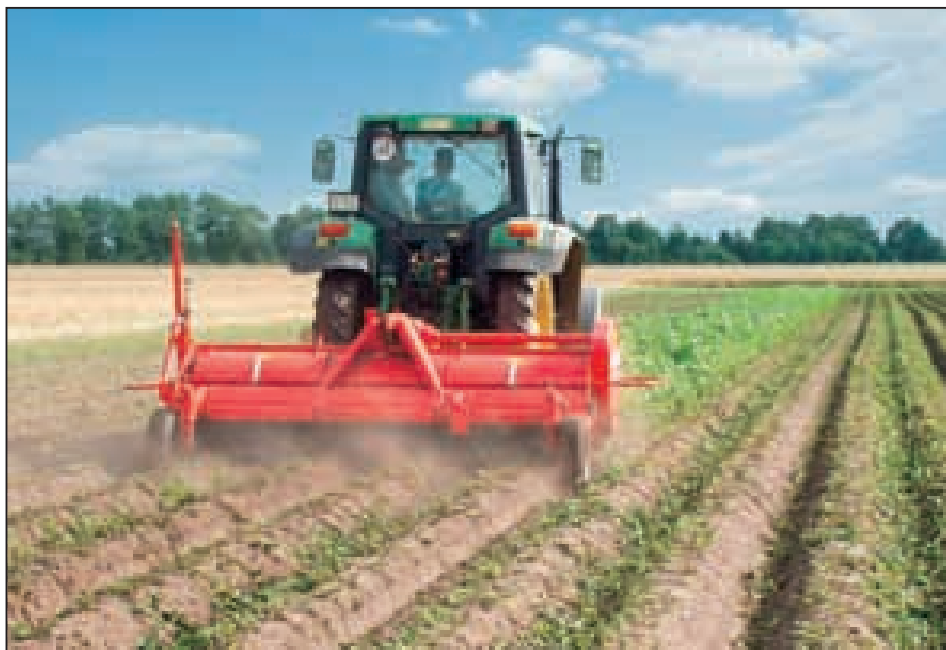
Puissant: le broyeur de fanes 4 rangs Grimme