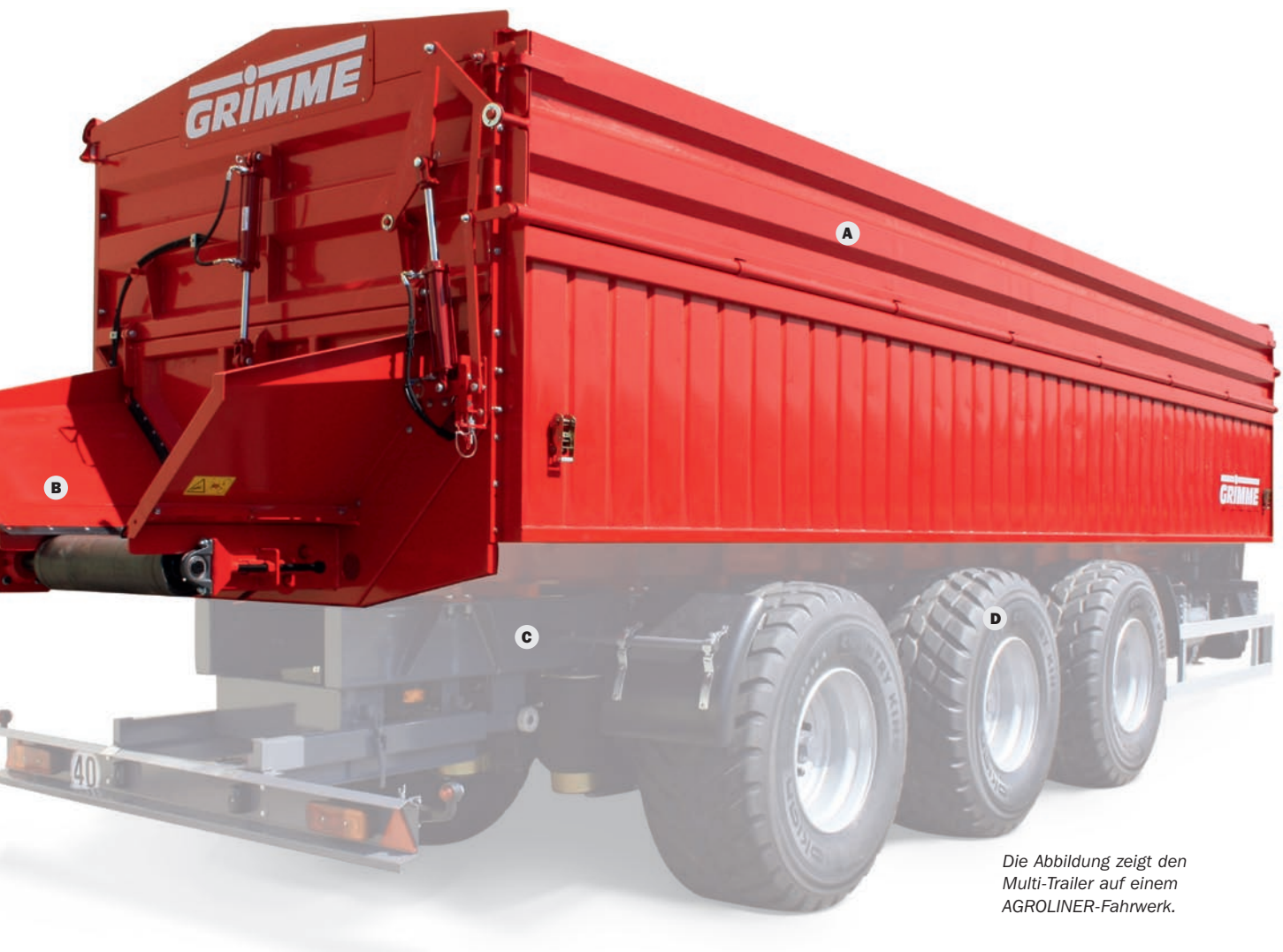
Die Abbildung zeigt den Multi-Trailer auf einem AGROLINER-Fahwerk.