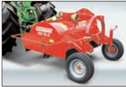
Perfekt gelöst: Die Umrüstung von Front- auf Heckbetrieb, durch das einfache Umstecken der Gelenkwelle