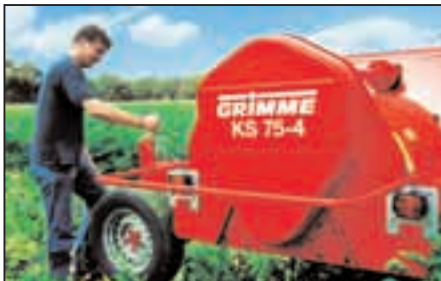
Damit schneiden Sie einfach besser ab: Die Stützräder dienen zugleich als stufenlose Höheneinstellung...