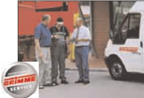
Partnerschaft im Dreiklang: der Grimme Eurodealer, der Werkmitarbeiter – und der Anwender

Was dabei herauskommt, wenn man die über 70-jährige Erfahrung der Grimme Kartoffeltechnik nutzt und damit eine optimal aufeinander abgestimmte Separierungs-, Lege-, Pflege-, Ernte- und Lagertechnik entwickelt? Ganz klar: eine ertragsmaximierte Kampagne! Neben der innovativen Technik ist das Servicekonzept ein weiterer Garant für den Erfolg. Hochqualifizierte Trainer unterrichten Eurodealer und Servicemitarbeiter für den Einsatz in über 60 Ländern direkt an der Maschine im TECHNICOM, um Ihnen mit zertifiziertem Rund-um-die-Uhr-Service, original Grimme Ersatzteilen und kompetenter Fachberatung jederzeit zur Seite zu stehen. Und das: direkt vor Ort! Der partnerschaftliche Dialog zwischen Anwendern, Vertriebspartnern und dem Werk macht sich dabei für alle Seiten bezahlt. – Einerseits profitieren wir von Ihren Erfahrungen in der Praxis und können diese bei der Konzeption neuer, praxisgerechter Lösungen einsetzen. Wie zum Beispiel bei der Entwicklung der KS-Serie. Andererseits profitieren Sie tagtäglich von unserem Know-how. Auf diese Weise erreichen wir – Kampagne für Kampagne – immer wieder unser gemeinsames Ziel: Erfolg ernten!