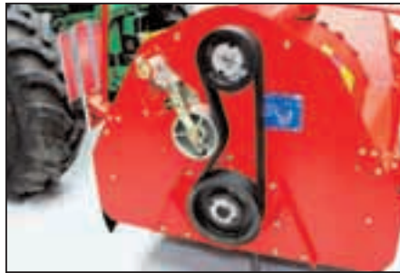
Schont Ihre Nerven: die automatische Keilriemen-spannung (KS 75-2, KSA 75-2 und KS 75-4)