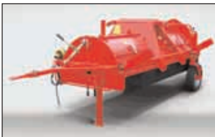
Entspannt – auch abseits der Felder: Mit der Grimme Längsfahreinrichtung (optional) sind Sie immer gut unterwegs.