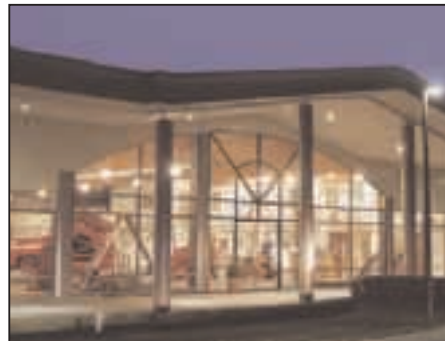
Know-how auf über 2000 m 2 : das Grimme Schulungs- und Ausstellungszentrum TECHNICOM ( TECH nik, IN formation, COM munication)