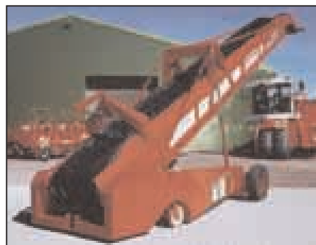
Innovationen seit über 70 Jahren: die Grimme Kartoffeltechnik