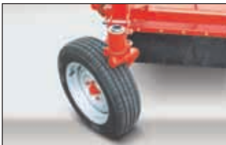
...und sind optional mit Pendelrädern erhältlich.