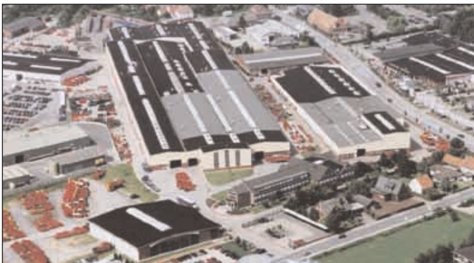
Der Standort: Grimme gehört zu Damme wie das Rot zu unseren Maschinen.