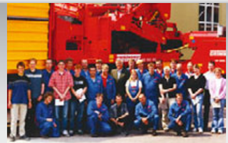
Beste Zukunftsaussichten: über 60 jungen Menschen wird mit einer fundierten Ausbildung eine gute Perspektive für das weitere Berufsleben geboten.