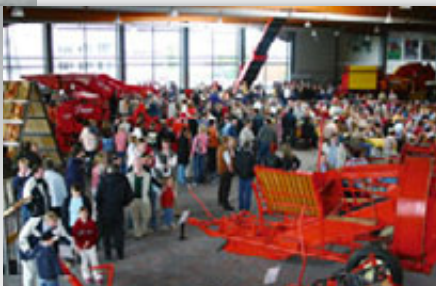
Unser Prinzip: feste arbeiten und Feste feiern. Beides macht zusammen am meisten Spaß.