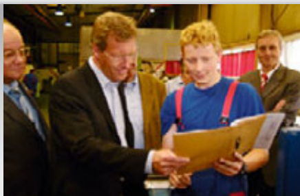
Im Dialog mit Politikgrößen: Der niedersächsische Ministerpräsident Christian Wulff (2. v. l.) informiert sich direkt vor Ort über den Ausbildungslehreplan.

Stark gewachsen: die Mitarbeiterentwicklung.