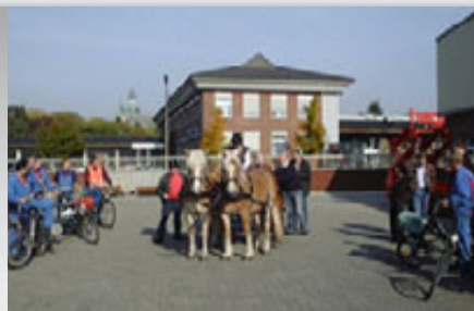
Einfallsreichtum ist auch gefragt, wenn es darum geht, Jubilaren eine besondere Ehre zu erweisen.